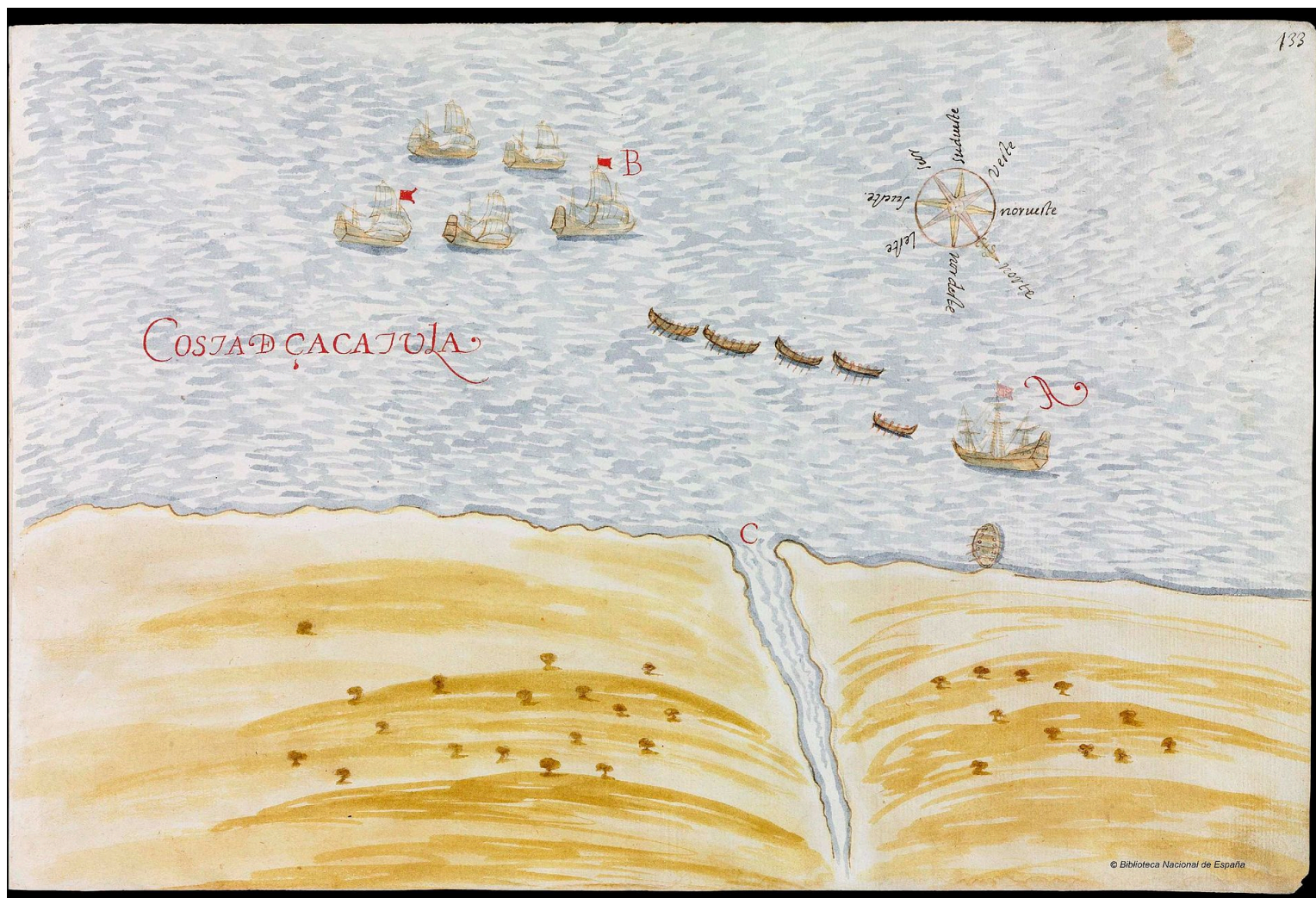
Combate naval entre holandeses y españoles frente a la desembocadura del río Balsas (llamado río de Çacatula en la leyenda del mapa), hacia 1615.

La llegada de los españoles a esta zona fue en torno a 1521 cuando Hernán Cortés envió a Rodríguez de Villafuerte a conquistar la costa de la Mar del Sur, y para 1523 se fundó la villa de la Concepción de Zacatula. Precisamente fue en Zacatula en donde los españoles establecieron el primer astillero de la costa del Pacífico a principios de 1522, en las inmediaciones del río Balsas, en un cuerpo de agua conectado al río Balsas y que los lugareños denominan Lagunita del Barco.