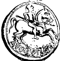
Calagurris Julia Nasica (Calahorra)

torio. Huyeron los enemigos, á quienes persiguió hasta los muros de Calahorra, donde les mató hasta tres mil. No les dejaba respirar, ni les daba tiempo para avituallarse; redújoles así á un estado de penuria insoportable á tropas regulares; aproximábase otro invierno, estación en que comunmente nada se atrevían á emprender en España los romanos, y todas estas causas reunidas movieron á Metelo á retirarse á su predilecto país de la Bética; Pompeyo traspuso esta vez los Pirineos y no paró hasta la Galia Narbonense.